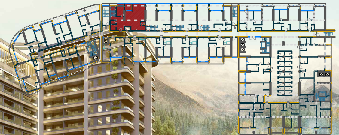
TLOCRT STANA X ETAŽA 1:100